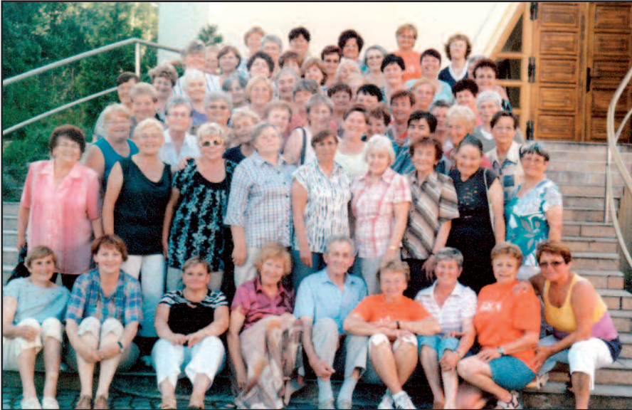
Naše poslední setkání před prázdninami s kamarádkami z Krásného Pole.

Myšlenky lásky a dobra nás naplňují štěstím a pohodou.